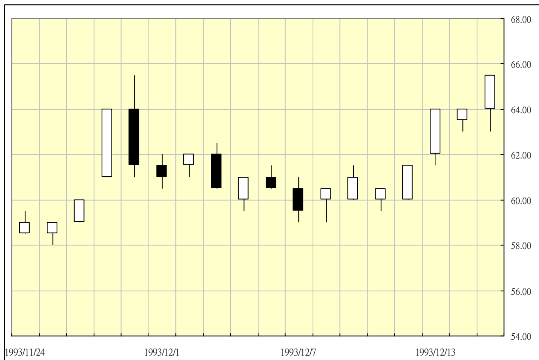
圖(一)：T50 股票 18 個營業日的日 K 線圖