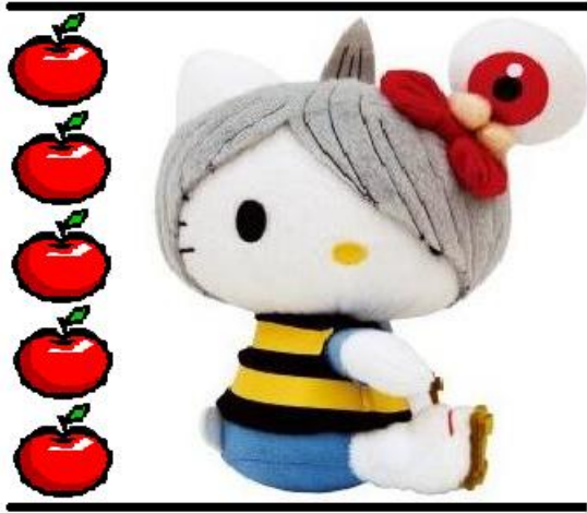
正臉測其身高為 5 個蘋果高

阿寶欲參加一年一度的沙雕比賽，他所設計的沙雕主題為：Hello kitty 喬裝鬼太郎遊富士山。下圖為阿寶在網路上抓取的利用蘋果做比例的 Hello kitty 圖形。