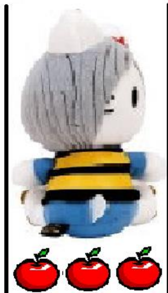
側臉測其身體最寬處為 3 個蘋果寬(蘋果高度、寬度視為相同)