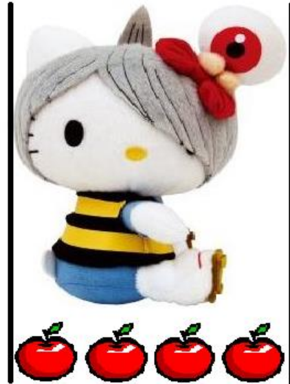
最寬處為 4 個蘋果寬