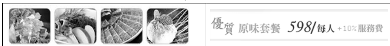
表三：燒肉餐廳價目表